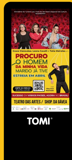
Temporada da Comédia